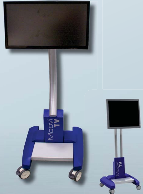
Existe en version double mât pour les écrans de grande taille