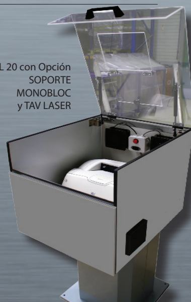
IL 20 con Opción SOPORTE MONOBLOC y TAV LASER