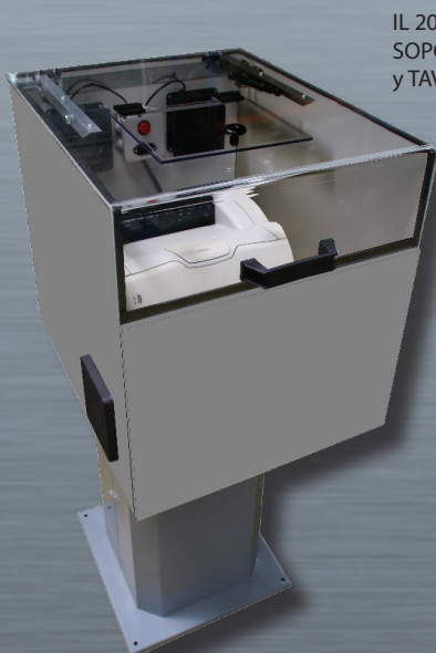
IL 20 con opción SOPORTE MONOBLOC y TAV LASER