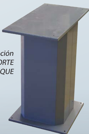
Opción SOPORTE MONOBLOQUE

Opción PIETEMENT MONOBLOC Soporte Monobloque