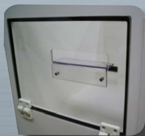
Salida Luz +Guía

Opciones SORTIE ETIQUETTES Salida de etiquetas