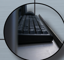
Butée pour la dernière tablette

DIMENSIONS DE L'AGRO GM rideau alu ou inox en mm :