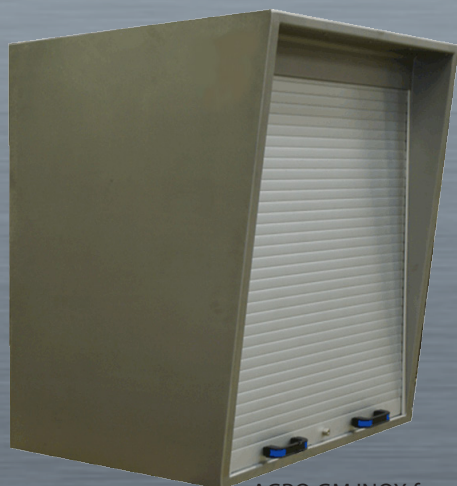
AGRO GM INOX fermé