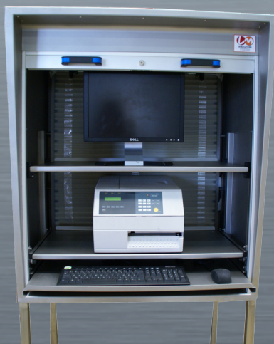
2 tablettes extractibles