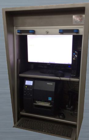
2 bandejas extraíbles