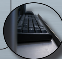
Reborde de 30mm