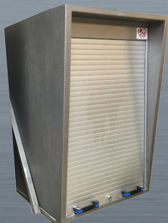
AGRO PM persiana articulada cerrada y opción SUPPORT MURAL