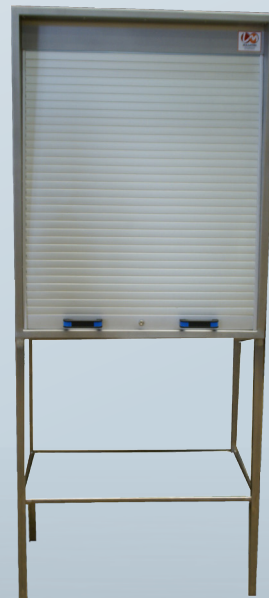
2 asas para facilitar el uso