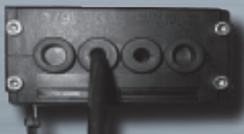
Option L2 : Lumière + Guide sur couvercle en PMMA