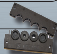
Opzione L2 : Fessura + guida coperchio PMMA