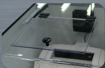
Opzione TAV LASER coperchio PMMA