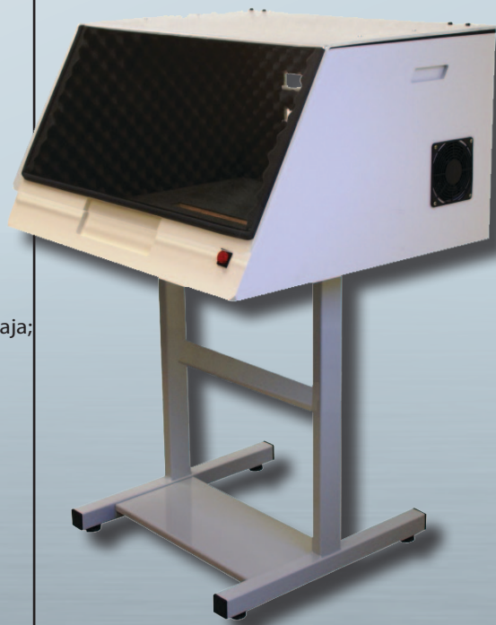
CAJA DE INSONORIZACIÓN con Opción Soporte SC 1

> Por favor, consúltenos para comprobar la correspondencia de su impresora con nuestras cajas de insonorización.