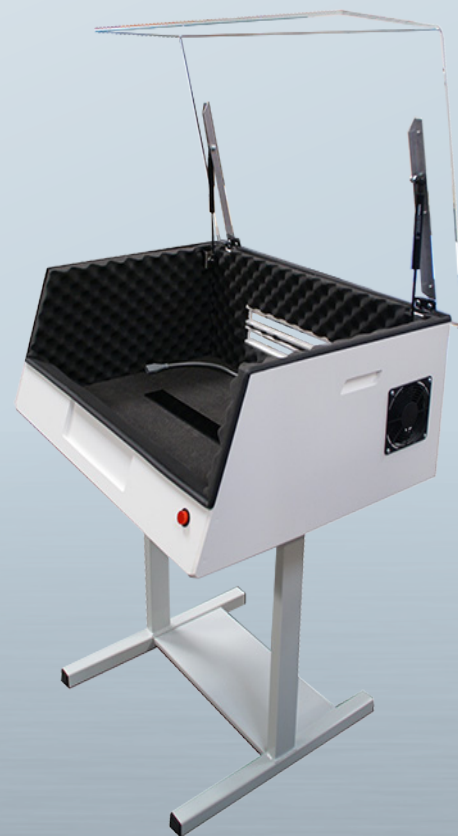
CAJA DE INSONORIZACIÓN con Opción Soporte SC 1