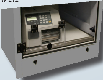
Sortie modèle TAV L12