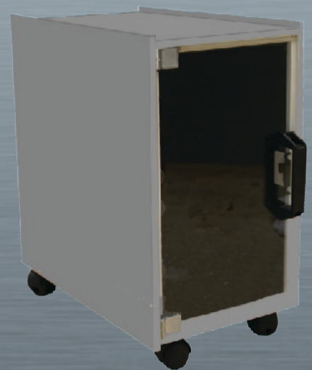
CPUC mit Option ROLLEN