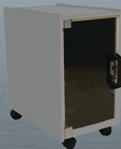
CPUC con Opción RULETAS