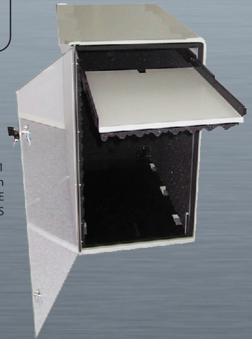
ISS 1 mit Option TASTATUR-ABLAGE und Option SCHLOSS