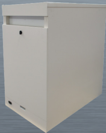
ISS 1: Ansicht der Rückseite