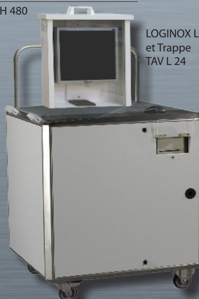
LOGINOX LCD et Trappe TAV L 24