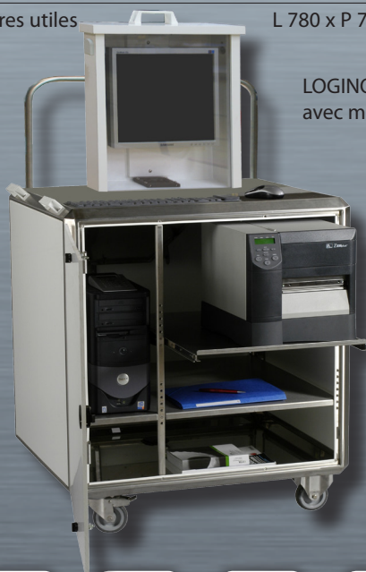
LOGINOX LCD avec matériels informatiques