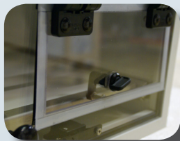
Sortie L 12

La solution de protection mobile INOX pour vos ensembles informatiques complets