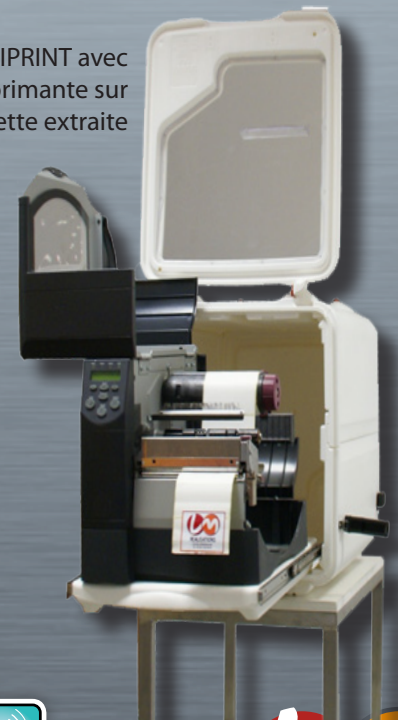
LOGIPRINT avec imprimante sur tablette extraite