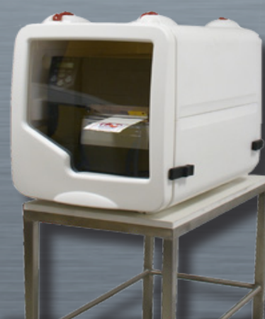
LOGIPRINT avec imprimante et LUMIERE + GUIDE