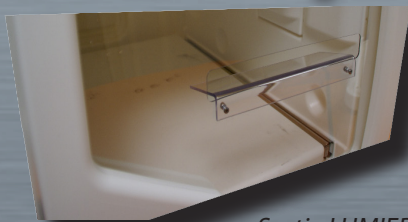
Sortie LUMIERE + GUIDE