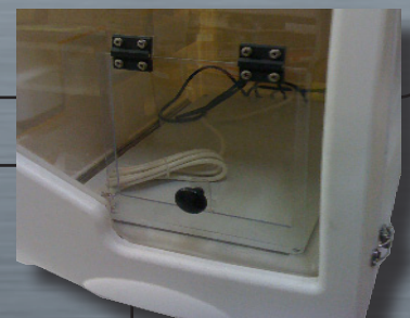
Sortie modèle TAV L 24