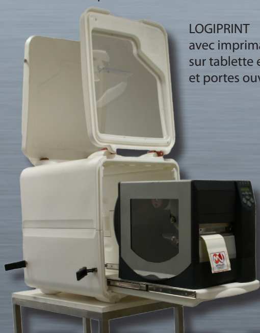
LOGIPRINT avec imprimante sur tablette extraite et portes ouvertes