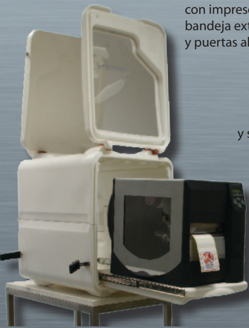
LOGIPRINT con impresora y salida de etiquetas con Luz y Guía LUMIERE + GUIDE