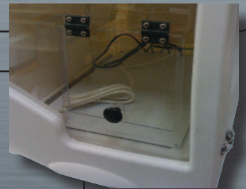
Salida TAV L 24