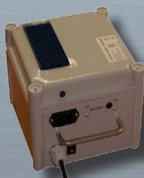
Batterie Litio ferro