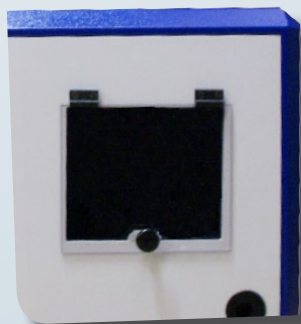
Uscita TAV L 24

Soluzione per applicazione informatica completa