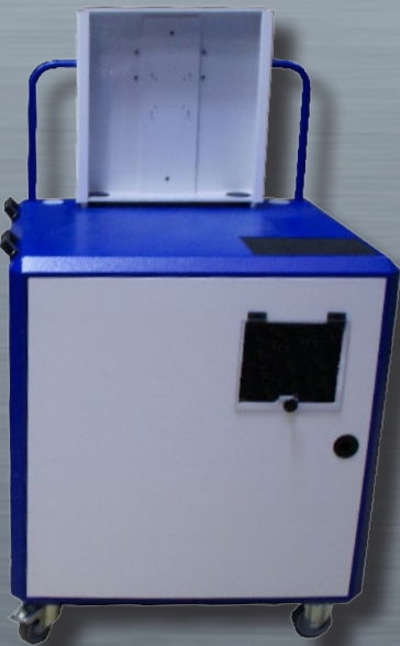
LOGIRACK LCD con stampante su ripiano estraibile e SUPPORTO PISTOLA