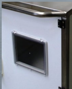
Sortie modèle TAV L 24