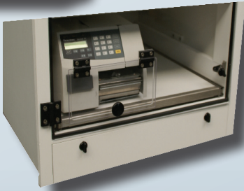
Ausgang Modell TAV L12