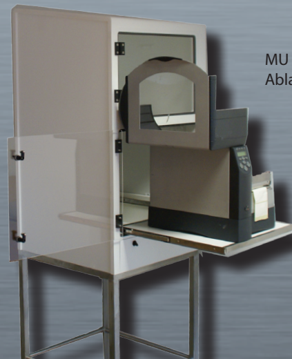
MU 3 mit ausziehbarer Ablage