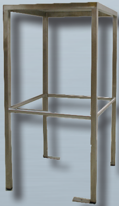
Option Verschiebbares Paneel