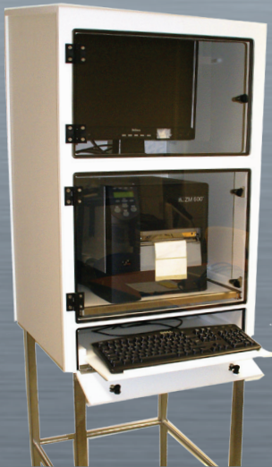
MU 3 komplett mit geöffneter Tastaturablage