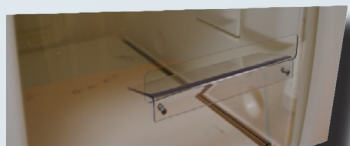
Uscita Fessura con guida