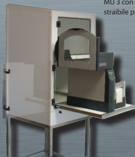
MU 3 con ripiano estraibile per stampante