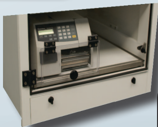
Uscita modello TAV L12