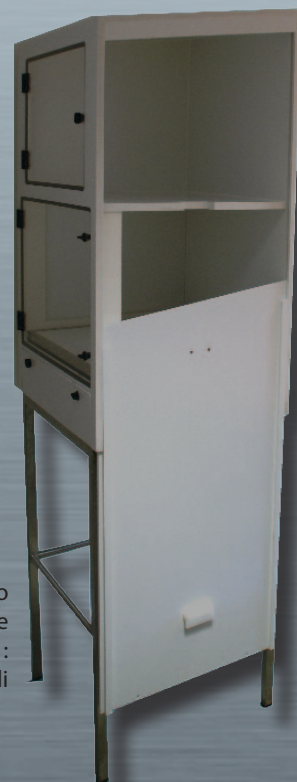
MU 3 con pannello laterale scorrevole verso il basso: accesso ai materiali