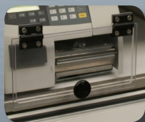
Sortie modèle TAV