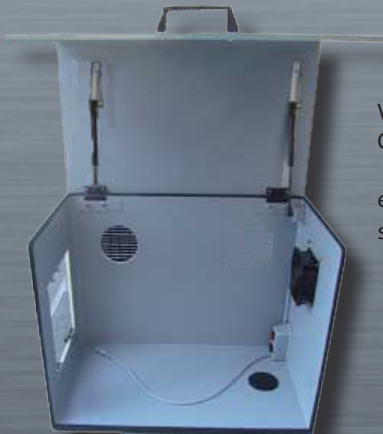
Vue intérieure du TGC : Ouïes d'aération sur la face latérale et ECA avec interrupteur sur la face arrière