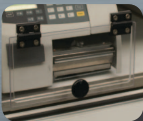
Ausgang Modell TAV