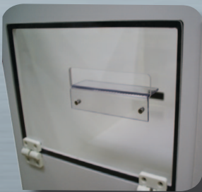
Ausgang LICHT + FÜHRUNG: