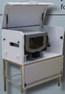
ZAG FD avec Option LUMIERE + GUIDE