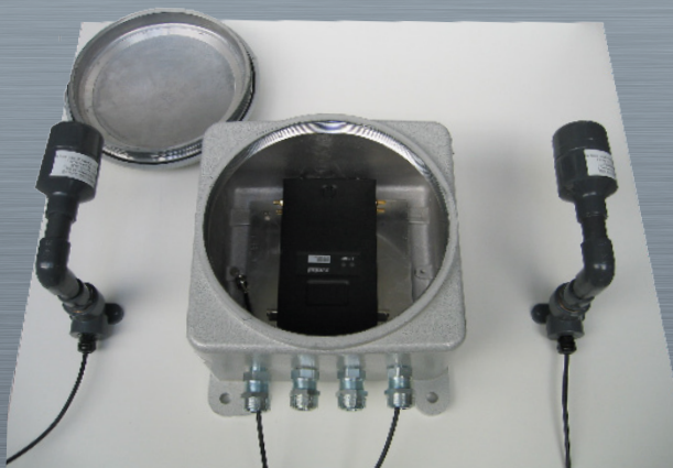
Coffret antidéflagrant avec antenne